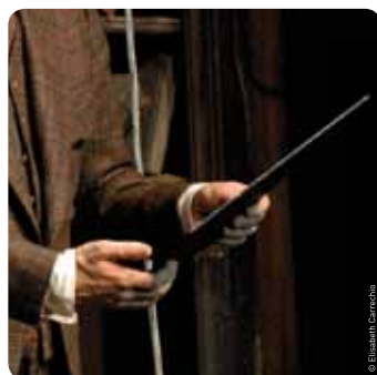
Mardi 14 février Théâtre " Le cas Jekyll "