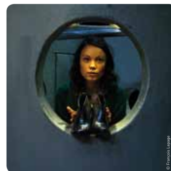
Jeudi 23 février Théâtre " Sur les pas d'Imelda "