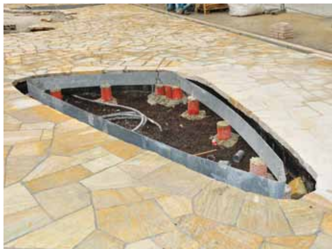
C'est ici que prendra place un des îlots végétalisés.