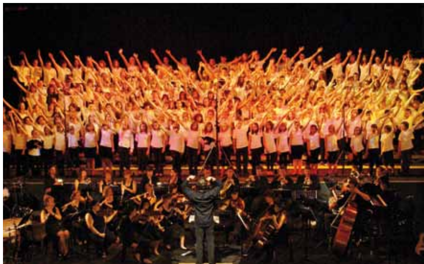
Près de 250 choristes participent chaque année au concert de "L'oreille en fête".