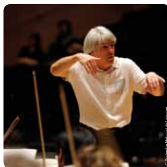
Vendredi 17 février Musique Orchestre National de Lorraine