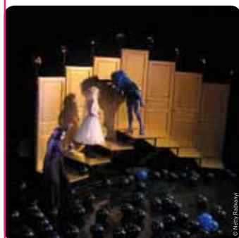
Mercredi 8, jeudi 9 et vendredi 10 février Théâtre " La Barbe bleue "

Spectacles programmés au théâtre Gabrielle-Dorziat / Renseignements et réservations au 03 26 51 15 99